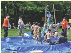
洋光台駅前公園プレイパークの様子

—心のふるさとづくりとして— プレイパークやにぎわいフェスタなど、大人から子どもまで輪になって文化活動を進めています。