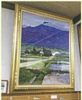
岡村西部連合町内会館に飾られている池田町の風景画

—文化交流のきっかけ～北アルプスに魅せられて～ 池田町の風景をこよなく愛した牧利保(1920-2006)は、全国池田1市6町が集まった「全国池田サミット」の文化顧問を務め、長野県をはじめとした全国の池田町の風景を多く残しています。