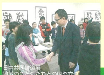
日中共同書道展 地域の子どもたちとの国際交流