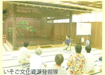
いそご文化資源発掘隊