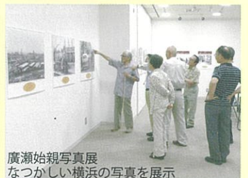
廣瀬始親写真展 つながしい横浜の写真を展示