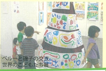
ペルーと磯子の交流 世界のこどもたち展