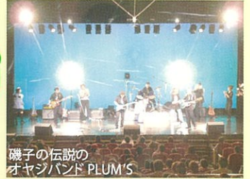
磯子の伝説の オヤジバンド PLUM'S