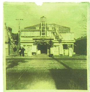
旧杉田劇場ポスター(左・中)旧杉田劇場正面写真(右)