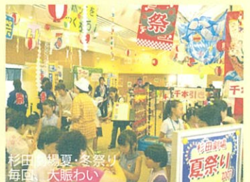
杉田劇場夏祭り 毎回、大賑わい