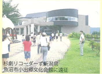
杉劇リコーダーず新潟県 魚沼市小出郷文化会館に遠征