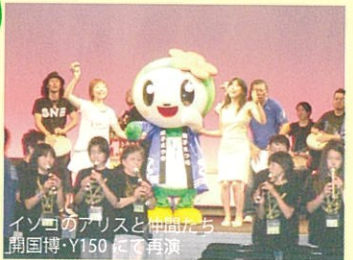
イソゴのアリスと仲間たち 開国博・Y150にて再演