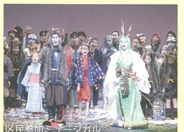
区民参加ミュージカル