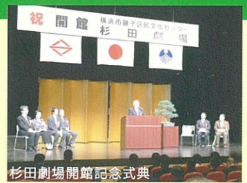
杉田劇場開館記念式典