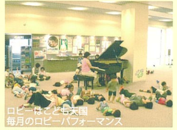
ロビーはこども天国 毎月のロビーパフォーマンス