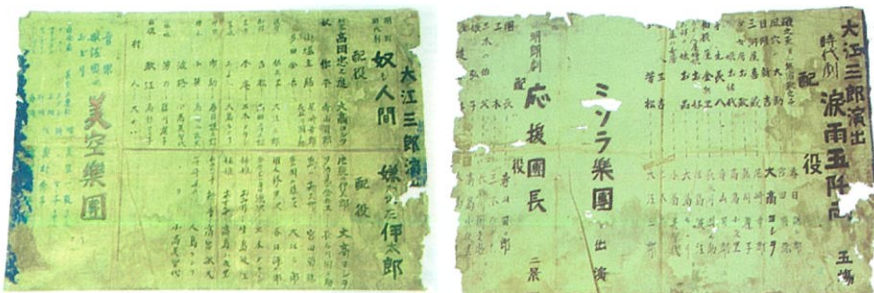
旧杉田劇場正面写真(左)、旧杉田劇場ポスター(中・右)

補遺: 旧杉田劇場は昭和25年10月に株式会社としての倒産となりましたが、以後も第三者の手によって昭和27年頃までは貸館事業の運営がされていたという裏付けが認められました。現在、当館の事業である「アート de 伝承プロジェクト」によって調査が進められております。