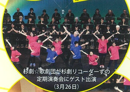
杉劇☆歌劇団が杉劇リコーダーずの 定期演奏会にゲスト出演 (3月26日)