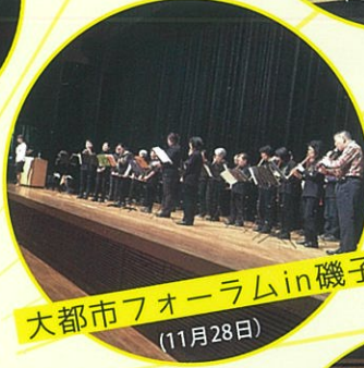
大都市フォーラムin磯子 (11月28日)