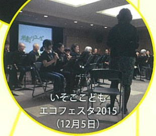
いそごども エコフェスタ2015 (12月5日)