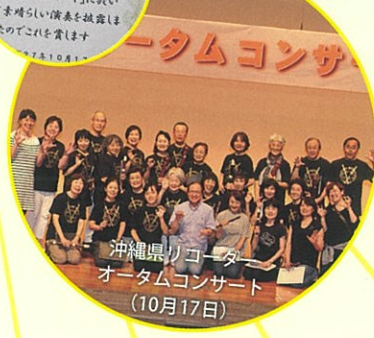
沖縄県リコーダー オータムコンサート (10月17日)

12歳から85歳まで のメンバーが大移 動、朗読とリコー ダー合奏のための音 楽物語「かけくま」を 演奏し、表彰される。